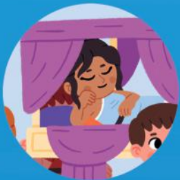
Una noble romana llevada en una litera.

Observa con atención la ciudad y encuentra a los siguientes ciudadanos y ciudadanas.