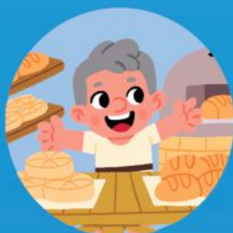
Un vendedor de pan en su panadería.