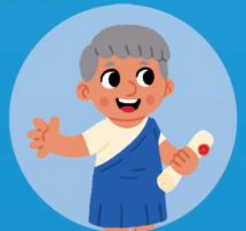
Un poeta recitando.