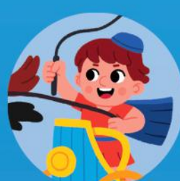
Un conductor de cuadrigas.