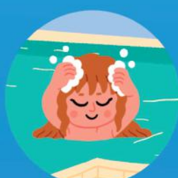
Una romana bañándose en las termas.