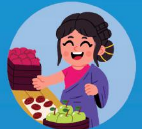
Una vendedora de fruta.