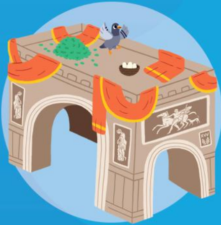
ARCO DE TRIUNFO

¿Puedes ver a estos personajes y elementos en la ciudad de Roma?